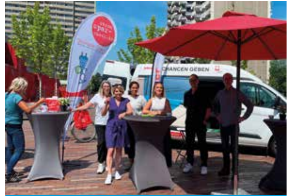
„Chancen geben“ für Langzeitarbeitslose in Chorweiler

// Nikola Plettenstein/Öffentlichkeitsarbeit