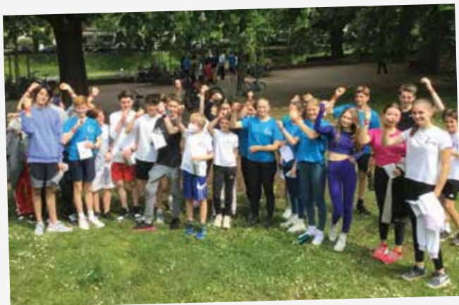
Große Freude bei den Schüler*innen über das Ergebnis des Spendenlaufs

Schüler*innen der Liebfrauenschule erlaufen bei Spendenlauf über 54.000 €.